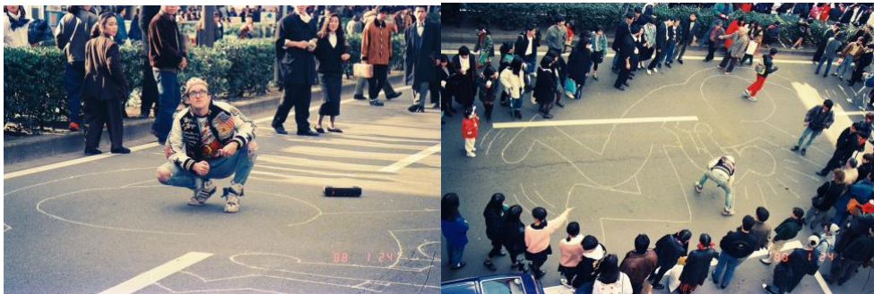
All Keith Haring Artwork ©Keith Haring Foundation

また、岸田晃氏と岸田力氏、それぞれの視点から語られる当時のエピソードも今回初めて紹介します。