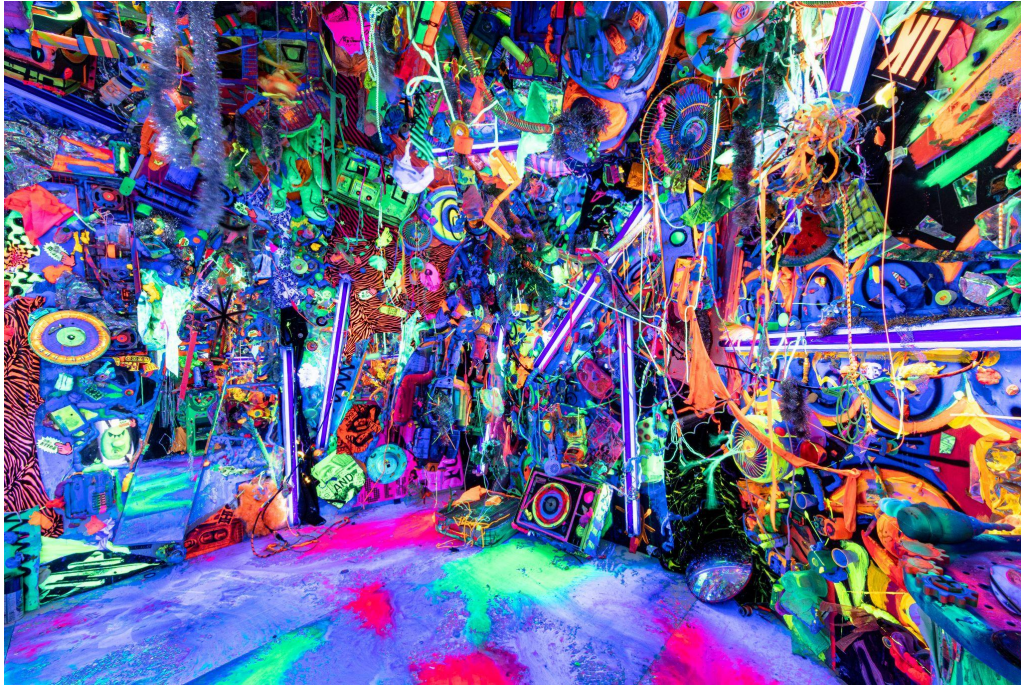
Installation view: Kenny Scharf solo exhibition "I'm Baaack", Nanzuka Underground, Tokyo, 2023

一般公開しました。シャーフはその一室を用いて、本作の原型となる《Closet》を発表しています。空間にひしめくオブジェクトがブラックライトによって発光する様子は、まるでシャーフの絵画の中に迷い込んだかのような体験をもたらします。