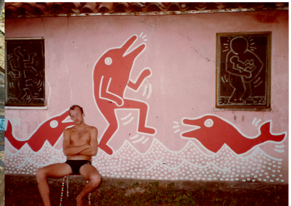
左：『Restless - Keith Haring in Brazil』（2013年）からのスチール 右：バイーア州（ブラジル）の壁画とキース・ヘリング, 1984年