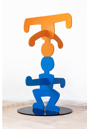
左：ケニー・ シャーフ 《REDDY GUY》 1986年/2021年 右：キース・ ヘリング 《アクロバット》 1986年、中村キース・ ヘリング美術館蔵