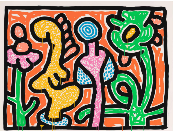
右：キース・ヘリング《フラワーズIV》1990年、中村キース・ヘリング美術館蔵