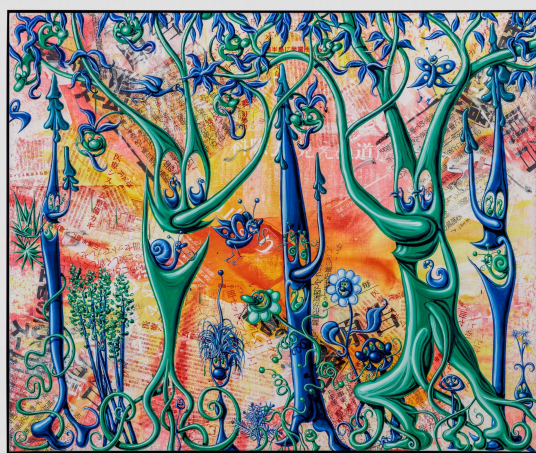
左：ケニー・シャーフ《JANGURU!》2023年

本展は(1)キース・ヘリング(2)ケニー・シャーフとキース・ヘリング(3)ケニー・シャーフの3つのセクションで構成されます。(2)では、二人の絵画や彫刻が一堂に会することで、その色彩や造形に見られる相互の影響や同時代性が浮かび上がる一方、シャーフのポップで宇宙的なイメージに満ちた世界観と、ヘリングの明快なラインによる象徴性という、それぞれの表現の個性も際立ちます。共鳴し合いながらも異なる方向へ展開していった二人の創作の魅力を、作品を通して体感いただけます。